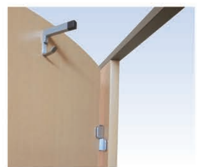
扉開口部もソフトエッジで優しく