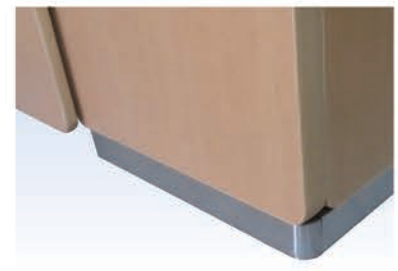
コーナー部はR加工巾木を使用します。